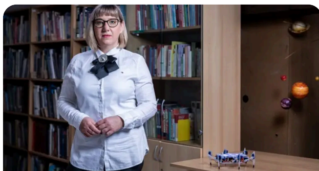
November 3, 2025