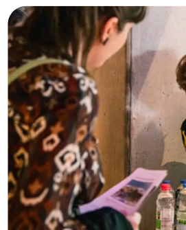
October 7, 2025