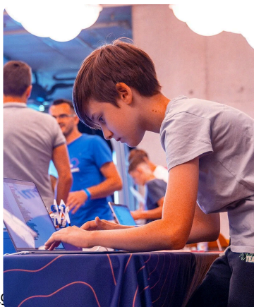
( https://sb.samoglasnik.com/wp-content/uploads/2026/02/stemi_homepage_carousel_vert_2.jpg ).